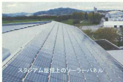
スタジアム屋根上のソーラーパネル