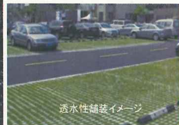
透水性舗装イメージ

施設:太陽光エネルギー・雨水再利用・壁面緑化・ 透水性舗装のエコロジー学習コーナー