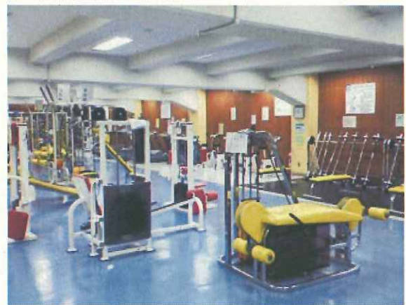
スポーツジムのイメージ