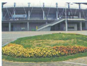
上段 キンチョウスタジアム 下段 フクダ電子アリーナ