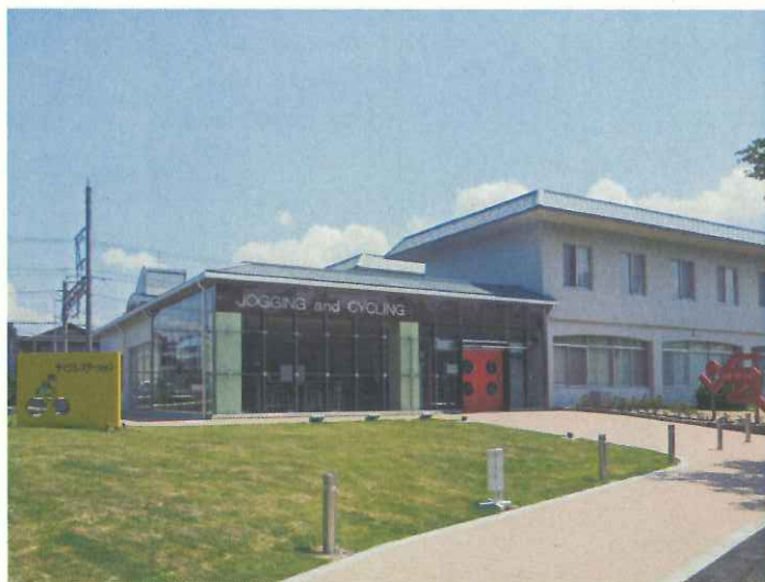
奈良県立橿原公苑