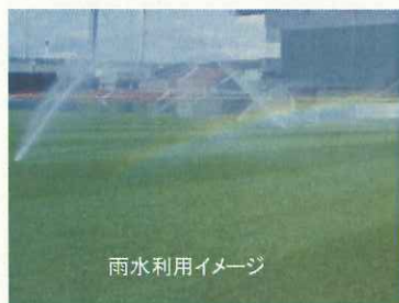
雨水利用イメージ