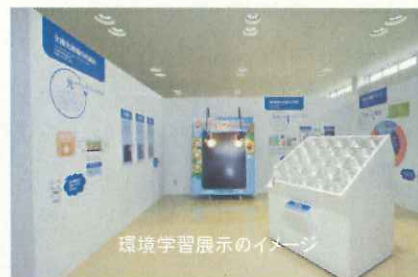
環境学習展示のイメージ