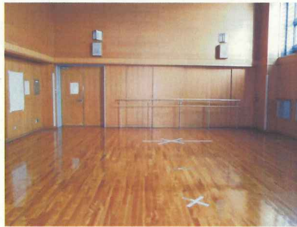
貸しスタジオ イメージ