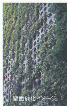
壁面緑化イメージ