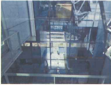
ガラス張り空間(シースルー)