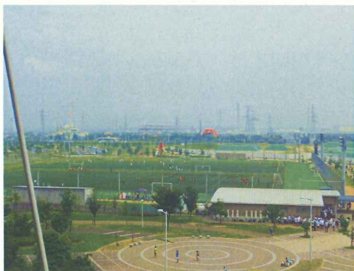
フクダ電子アリーナ