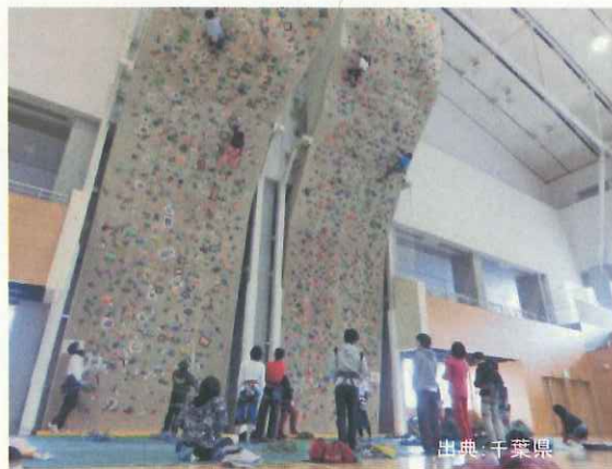
クライミングウォール イメージ