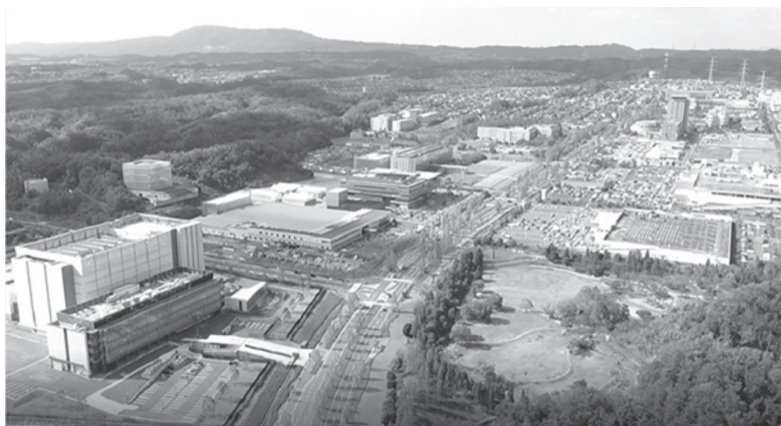
関西文化学術研究都市

そして、こうした発展による未来への明るい希望の下で、人々が、末永く生きがいを持って暮らし、互いに認め合い大切にしよう豊かな人間関係を構築し、さらに、こうした人々の暮らしが営まれる山城地域が、恵まれた自然環境や、平城京と平安京の中間に位置する中で培われてきた豊かな歴史や文化が生み出す創造や活力で満ちあふれていくことをめざします。