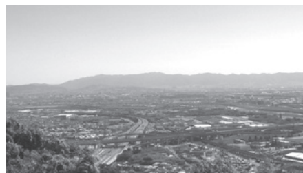
天王山から見た乙訓地域