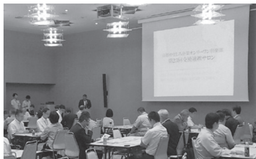
京都やましろ企業オンリーワン倶楽部勉強会