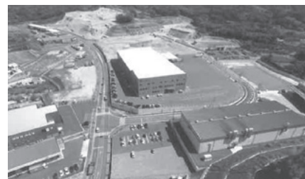
白坂テクノパーク

これらを踏まえて、山城地域の4つの地域特性に応じ、それぞれの地域づくりを推進するとともに、各施策の成果を山城の4つの地域にも波及するよう相互連携を図ることによって山城地域全体の発展につなげていきます。