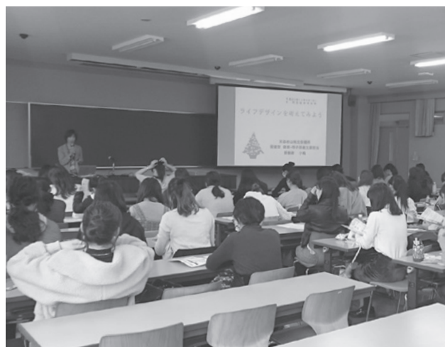
ライフデザイン講座