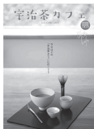
宇治茶カフェガイドブック