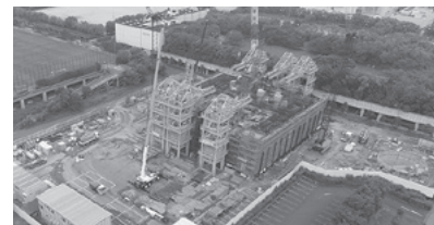
いろは呑龍トンネル