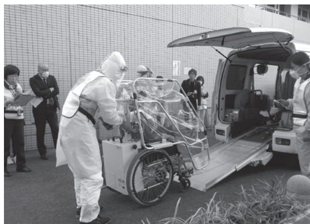
新型インフルエンザ等対応訓練

また、山城地域の優れた歴史的風土や豊かな自然環境を、大切に次世代へと引き継いでいくことが重要です。