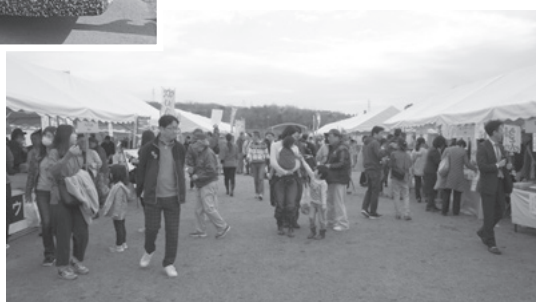
宇治茶・山城ごちそうフェスタ