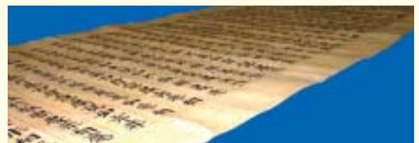
大般若波羅蜜多經