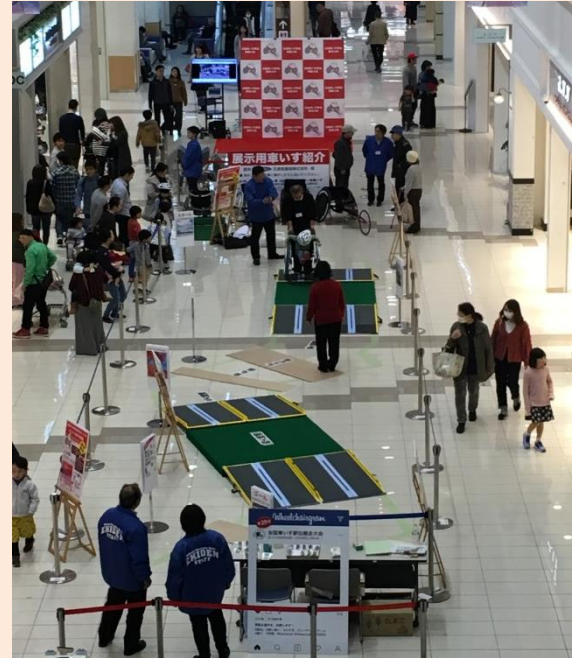
コース全体図。車いす駅伝のコースをイメージしてスロープ等を設置。

https://www.kbs-kyoto.co.jp/tv/challenge/ (当日の様子は4月15日(日)12時からの放送で取り上げられる予定です)