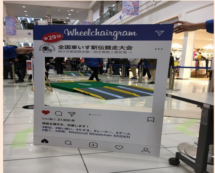
参加者にはチョコレートのプレゼントの他、パネルでの写真撮影も実施。