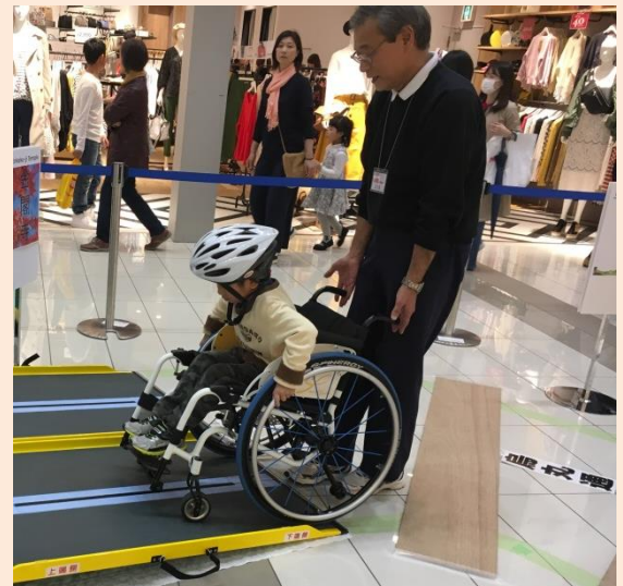
試乗中の様子。 少しの坂道も登るのは案外難しい。