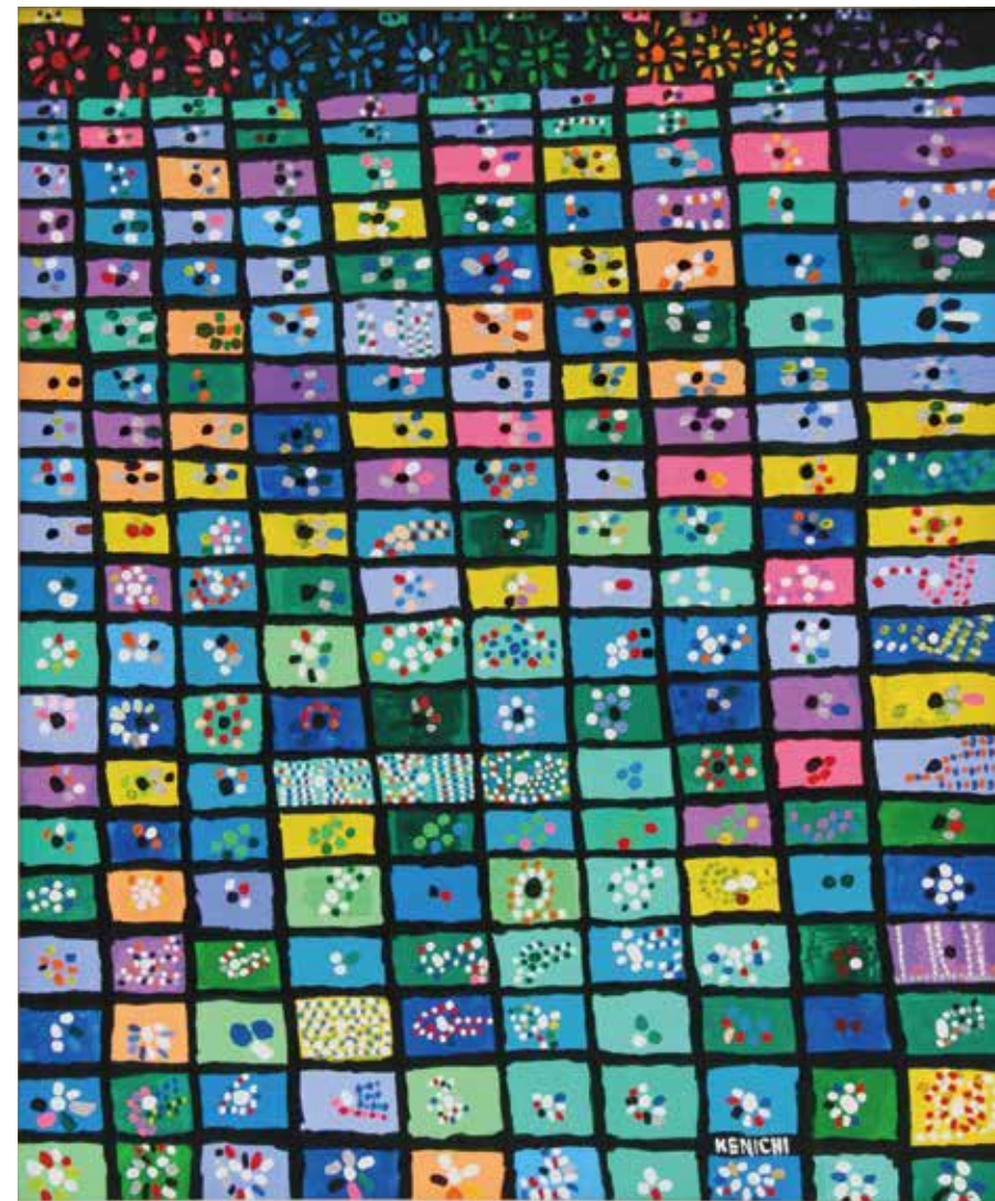
平成28年度 絵画部門 京都市長賞 「真夏の夜空に咲く花火」 大柳 憲一