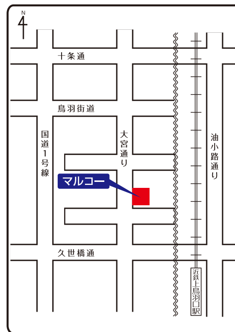
ウイングスマルコー配送センター地図

株式会社ウイングスマルコー配送センター 〒601-8121 京都市南区上鳥羽大物町29 TEL 075-694-5044