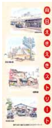
向日えきえきストリート (マップ)

新しい商業連携と開発意欲を備えた商店街を創出するため、商店会「向日えきえきストリート」を設立。26名が参加し、ビジョン策定やイルミネーション事業、商店街マップ制作を実施。市民に認知されるとともに、波及効果として新規出店や店舗改装が加速した。