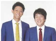
ネイビーズアフロ