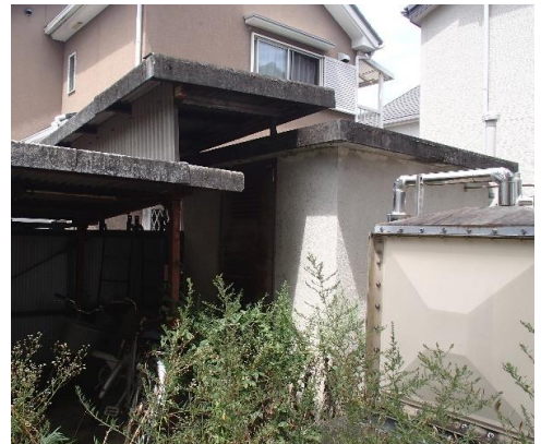
附属建物3・ポンプ室