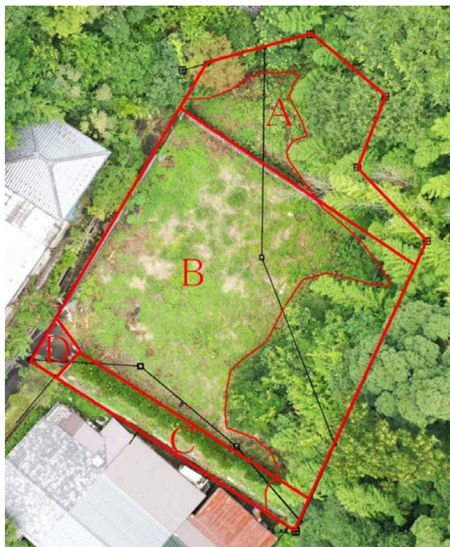
(上記写真への図示は、その位置及び縮尺に若干のズレが生じている可能性があります。) (A～Dは物件調書の地勢等の区分、細い線は備考3の越境樹木の影地範囲を示したものです。)