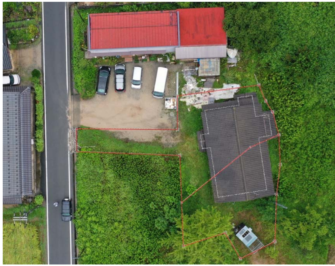
(上記写真への図示は、その位置及び縮尺に若干のズレが生じている可能性があります。)