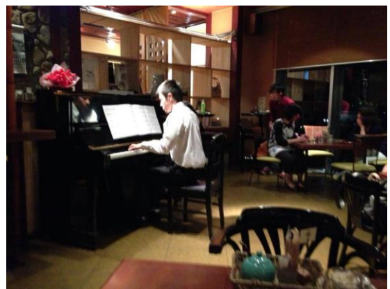
生演奏ディナーの実施 若い方の発表の場