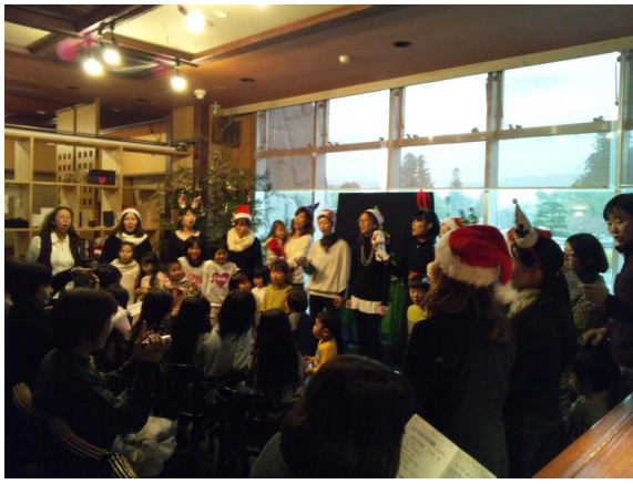
親子参加のクリスマス会開催