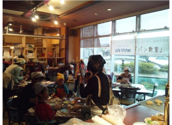
地域の子ども達とパン教室の開催