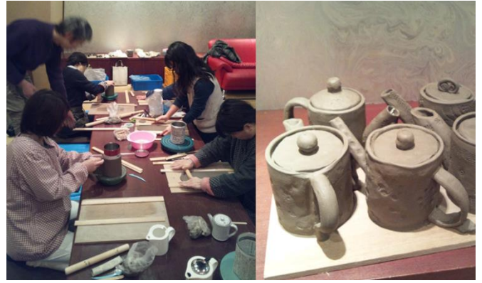
陶芸教室でポットを作成