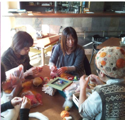
羊毛フェルトづくり