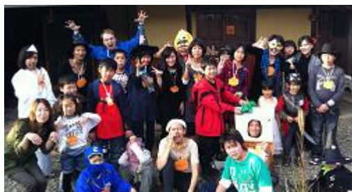
ハロウィンパーティの様子。トリックオアトリート！