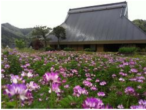
春のふるま家。毎年蓮華の花が見事です。