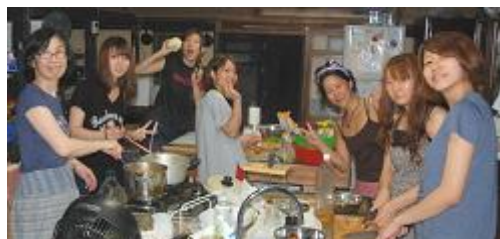
英語 & キャリア合宿で。みんなでご飯のピザ作り