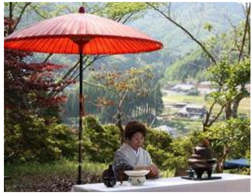
地元団体、城山を守る会とコラボした野点イベント