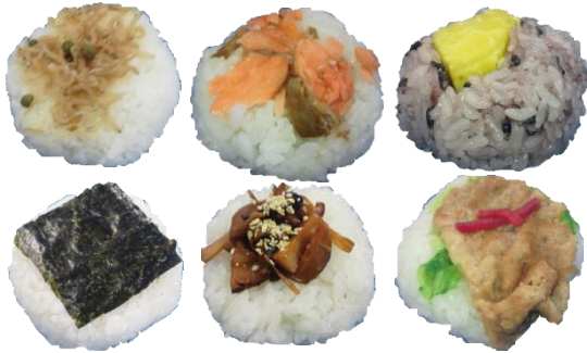
売れ筋のおむすび

JointJoy とは、喜びをつなぐ、ただそれだけの場所でありたいと願い皆で名づけた名前です。人と人はジョイントの金具のように何かでつながりながら生きています。その結び役に徹し、障がいのある方達の「出来る」を探し実践しながら、ここにいる皆がステップアップしていきます。