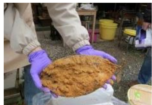
そんなこと出来るの？ということも皆で一緒にすれば 楽しく進む最近開催して、人気だった「へしこ」づくり