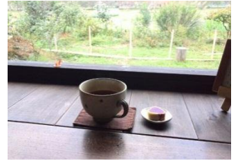
癒えるムード満点のこもれび。 大きな窓からの地域の眺めが最高