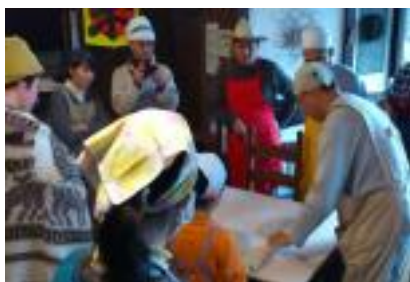
そば打ち体験教室とそば畑づくり