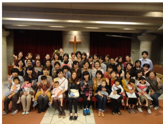
福島の幼稚園との交流会