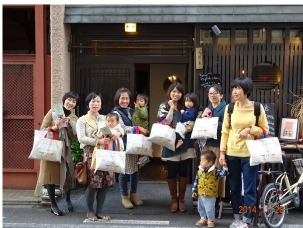
おそろいのオリジナルバッグにて