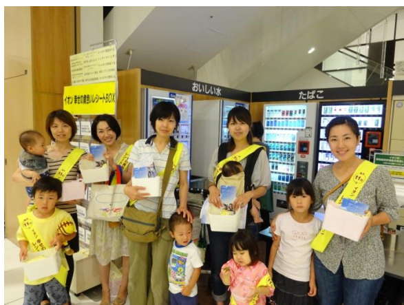
イオン桂川店の黄色いレシートに参加