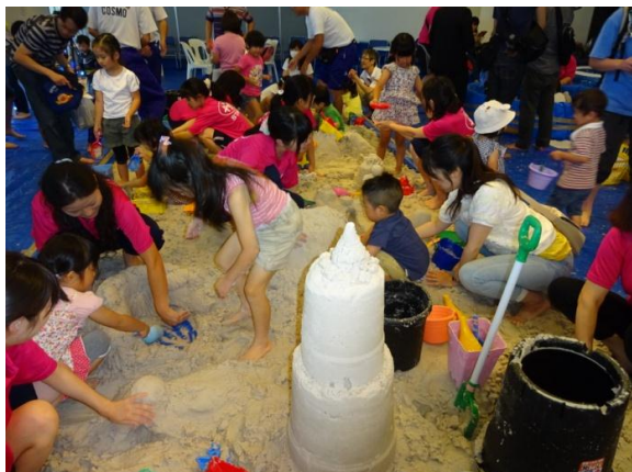
福島への砂場の寄贈