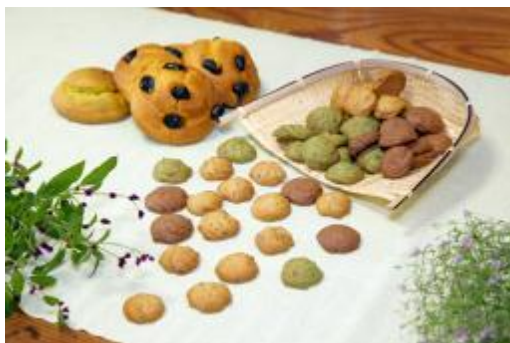
ケーキ・クッキー