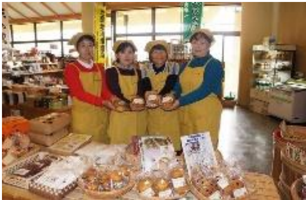
元気いっぱい お母さんらのメンバー