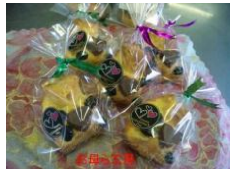
バレンタインバージョン