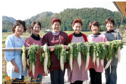
“京都ものがたり協同体・京都つながるネットのメンバー