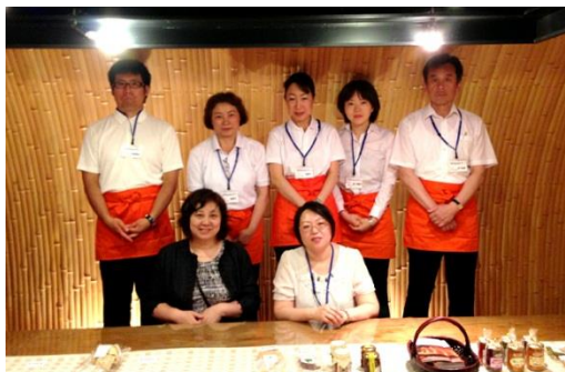
わたしたちが応援しています！！