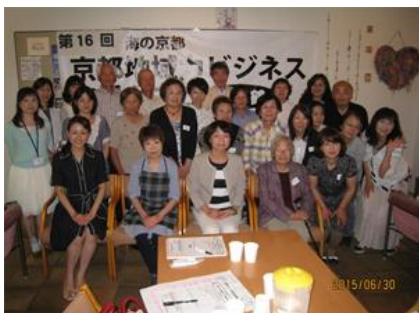
第16回 地域カビジネス応援カフェ