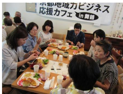
応援カフェでの試食と意見交換の様子