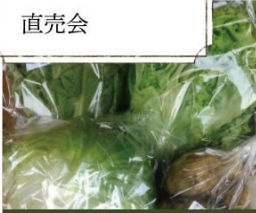
丹後のとれたて野菜