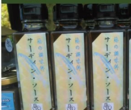
オリジナル・サーディンソース