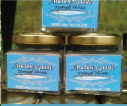
オリジナル・アンチョビペースト