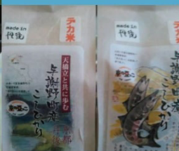
丹後のこしひかり