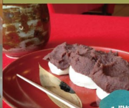
智慧の餅+ほうじ茶セット