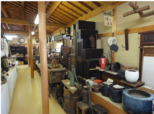
京の田舎民具資料館