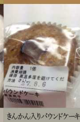
きんかん入りパウンドケーキ