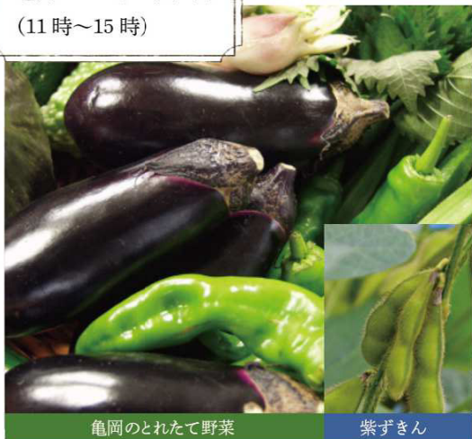
亀岡のとれたて野菜