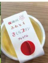
ふわとろさくらプリン