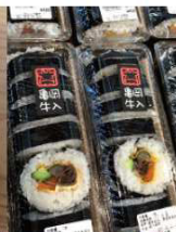
亀岡牛入り巻きずし