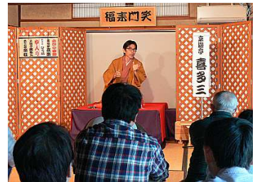
オプションの保津川寄席