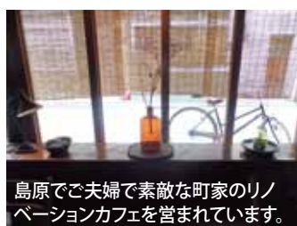
島原でご夫婦で素敵な町家のリノ ベーションカフェを営まれています。