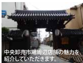
中央卸売市場周辺店舗の魅力を 紹介していただきます。