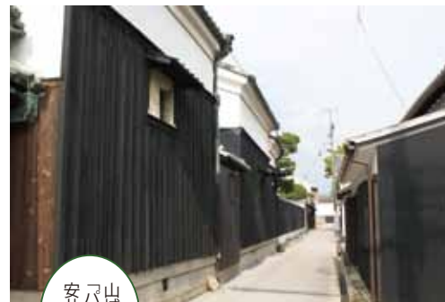
山城町のパン屋 「パネッテリアプルチーノ」 安井健太郎・菜穂美さんご夫妻