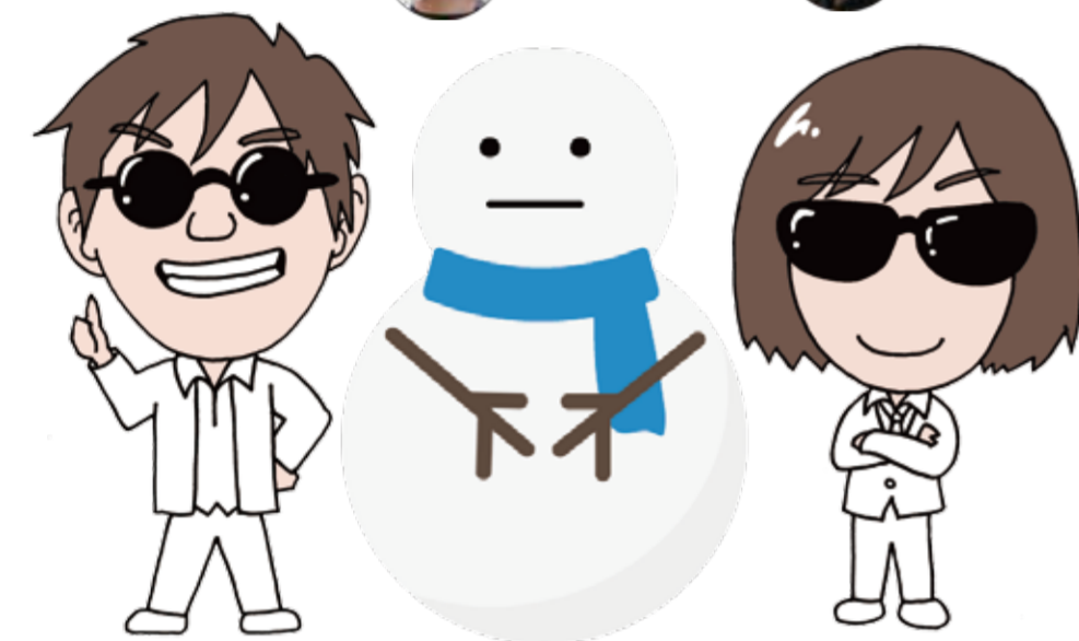
<冬の京都ちーたび共同広報実施主体> 京都府・地域力再生プラットフォーム京都ちーたび