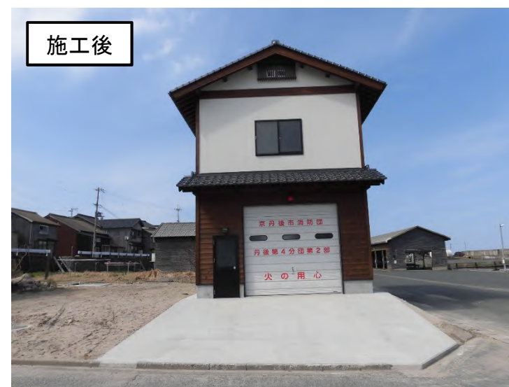
中浜消防車庫整備事業 (丹後町中浜)