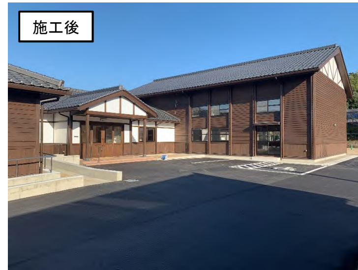
島津ふれあいセンター整備事業 (網野町島津)