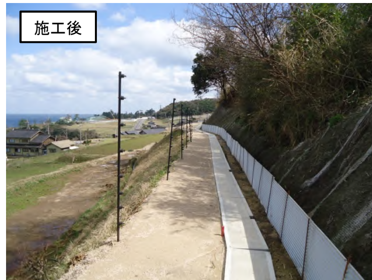
尾和用水路改修事業