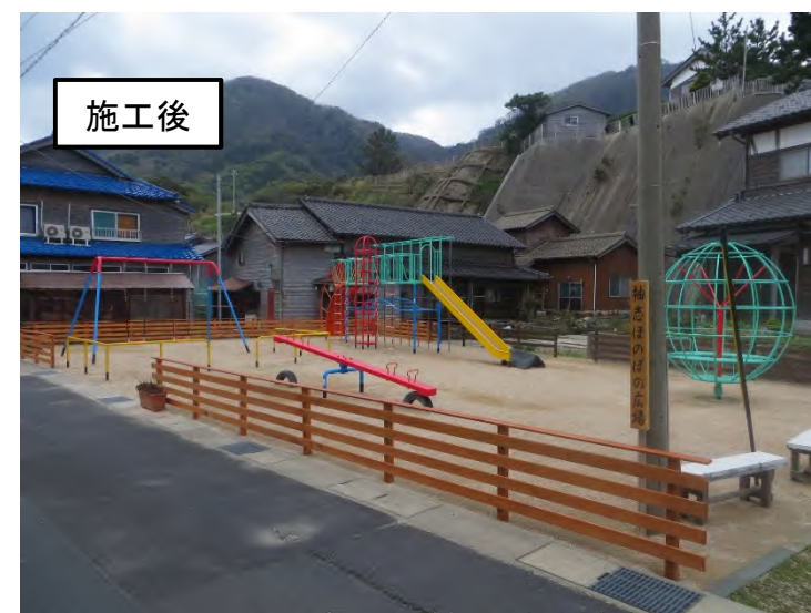
親子ふれあい広場整備助成事業 (丹後町袖志)