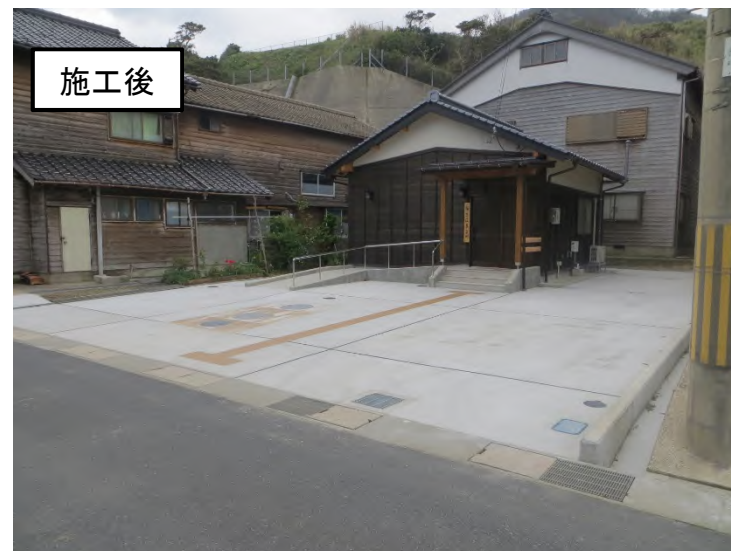
区民交流広場整備助成事業 (丹後町袖志)