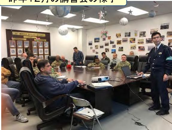
昨年12月の講習会の様子

本年3月の講習会では、京丹後警察署からの講義に加え、ドライブシミュレーターを使用し、車両走行時に遭遇しやすい危険な場面を疑似体験することで危険予知の能力を高めるトレーニング等を行いました。