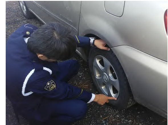
本年3月の講習会の様子