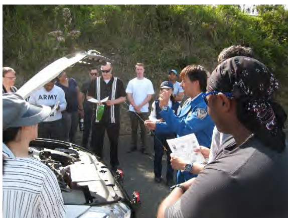
車両の点検方法の確認