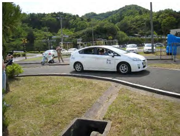
バック走行を通じた車両感覚の習得②