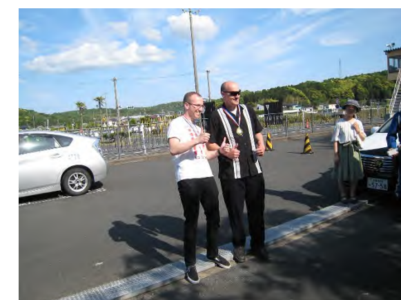
運転優秀者の表彰