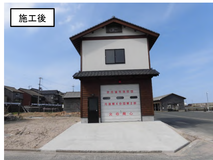
中浜消防車庫整備事業 (丹後町中浜)