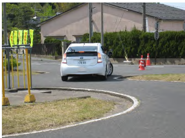
バック走行を通じた車両感覚の習得①

今回の講習会では、特に日本の道路構造に即した運転技量の習得に焦点を当て、教習所内のコースを使用した実車講習を行い、加えて日本語標記の道路標識の読み方の講義や車両の点検方法の確認を行いました。