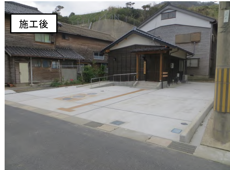
区民交流広場整備助成事業 (丹後町袖志)