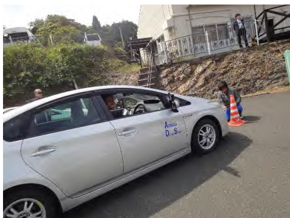
接触事故を防ぐための実車講習②