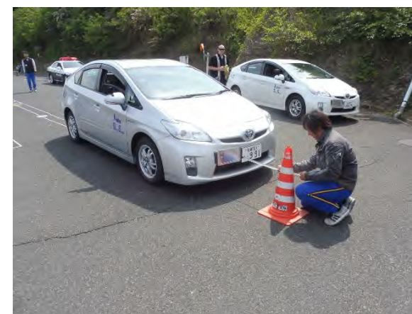
接触事故を防ぐための実車講習①