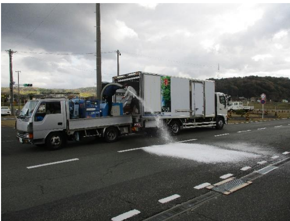
人工降雪機による積雪路の再現