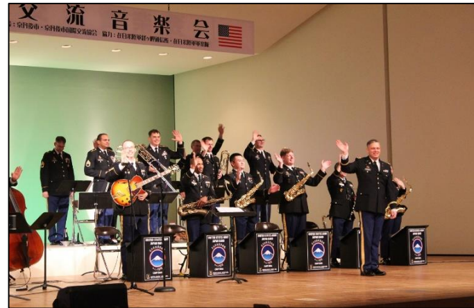
京都府丹後文化会館