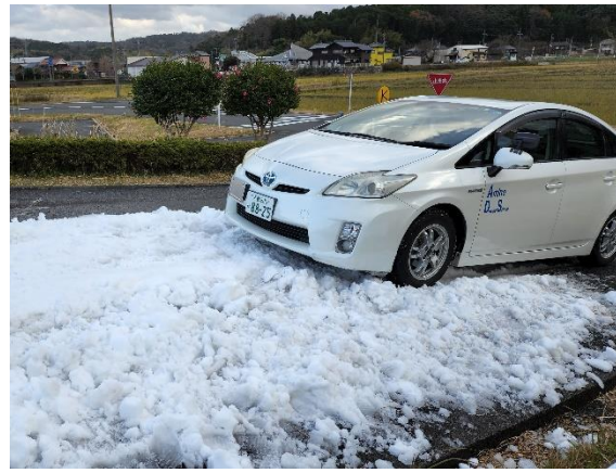
積雪路面におけるスリップ体験