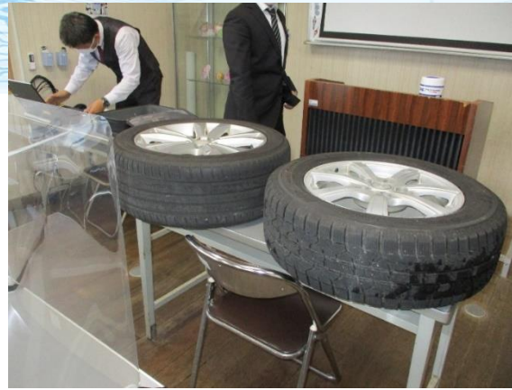
通常のタイヤとスタッドレスタイヤの比較