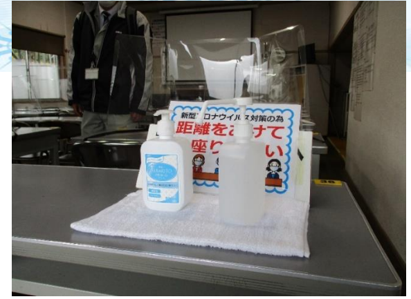
万全な新型コロナウイルス感染症対策のもとでの講習