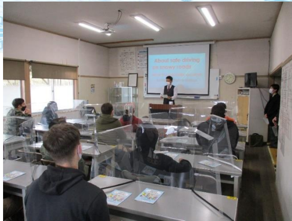
冬季の注意点等に関する警察の講義

今回の講習会では、万全な新型コロナウイルス感染症対策のもとで、本格的な降雪期を迎えることを踏まえ、冬季の運転において注意を要する事項に重点を置いた座学講義や、人工降雪機を使用して再現した積雪路の走行体験、車両感覚を養うためのトレーニングなどを内容とした実車講習を行いました。