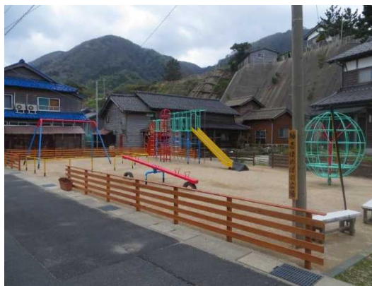
親子ふれあい広場整備助成事業(袖志区)