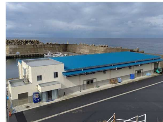
間人漁港荷捌所等整備事業(基金)