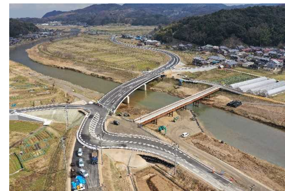
間人大宮線（大門橋右岸から撮影）