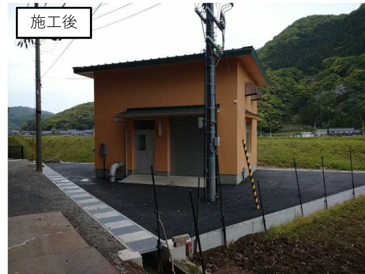
尾和揚水機場整備