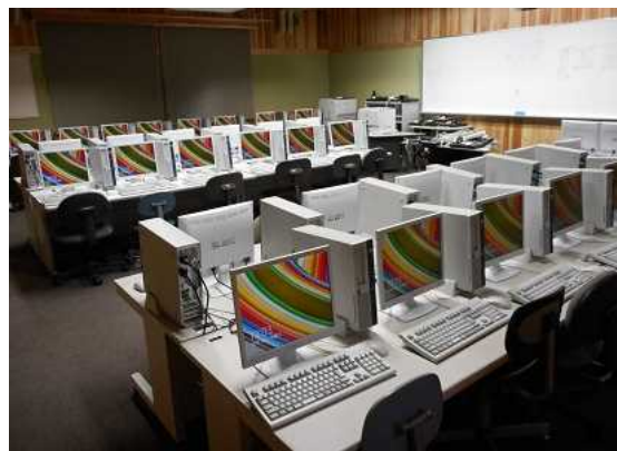
情報教育環境整備