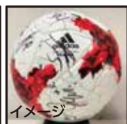
⑥ サイン入り Jリーグ公式試合球