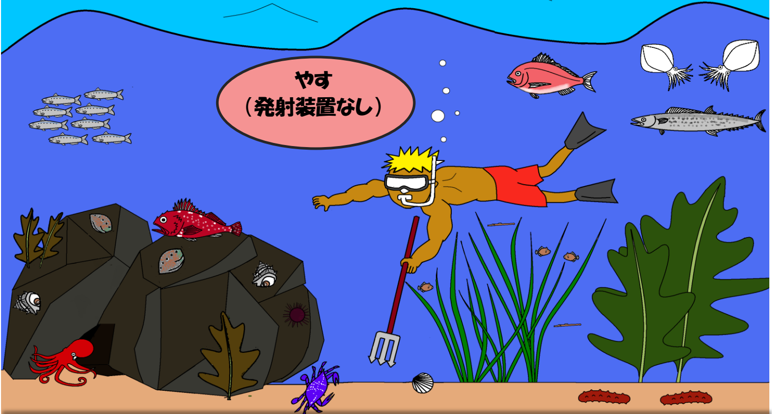
やす (発射装置なし)

一般の方が使用可能な漁具・漁法であっても捕ってはいけないものがあります。 (例)サザエ・アワビ・タコ 等 採捕した場合、漁業権の侵害や調整規則の違反等に該当する場合があります。