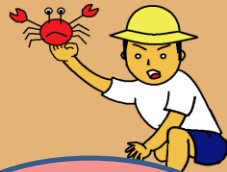
徒手採捕 (海中も含む)