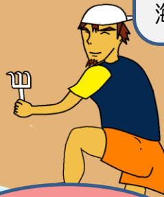
は具 (くまで、じょれん等)

一般の方が海で使ってもよい漁具・漁法は決まっています。ルールとマナーを守って楽しく海で遊びましょう。