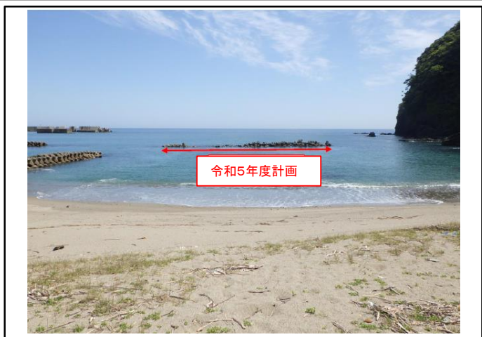
海岸保全施設 離岸堤