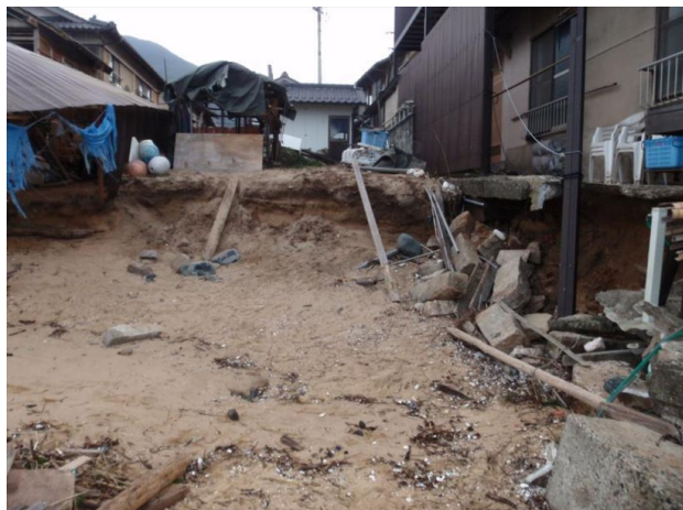
平成29年台風21号被災状況