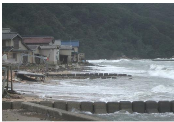
住家に押し寄せる波浪状況