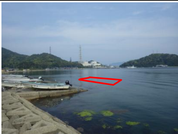
R 5 整備予定箇所