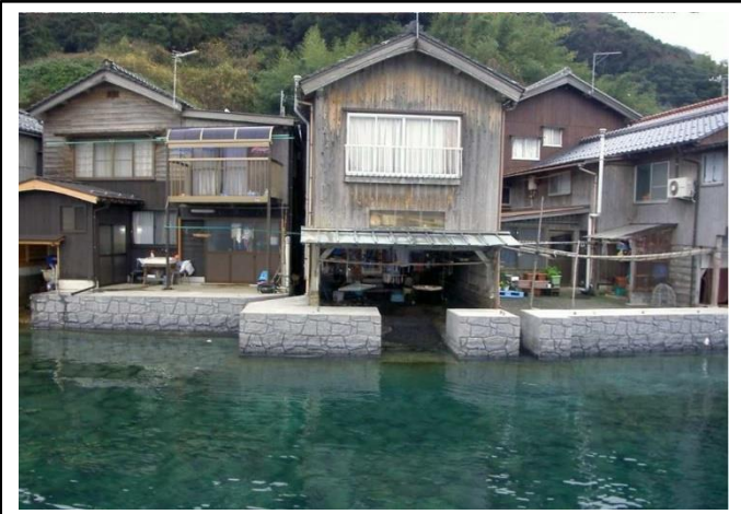
護岸整備後イメージ