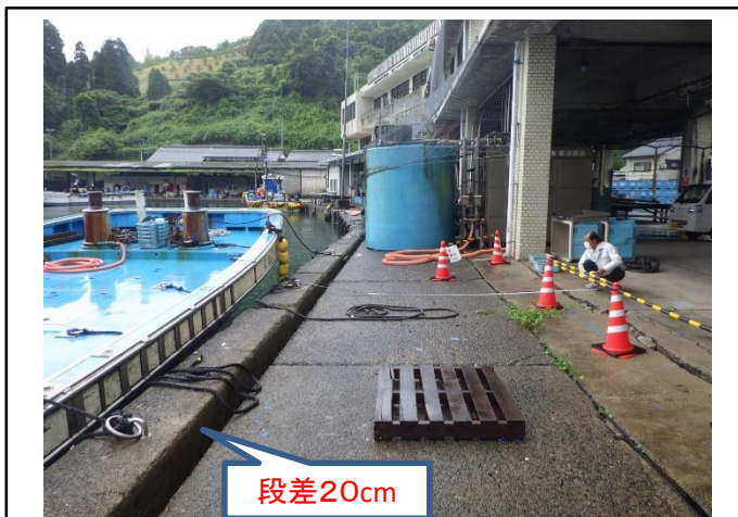
大浦第1岸壁 老朽化状況