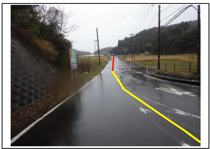
伊根地区水産飲雑用水施設