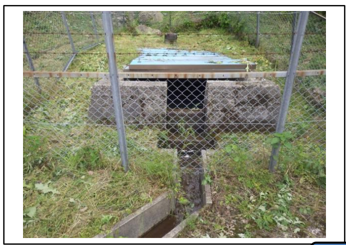
本庄地区取水施設