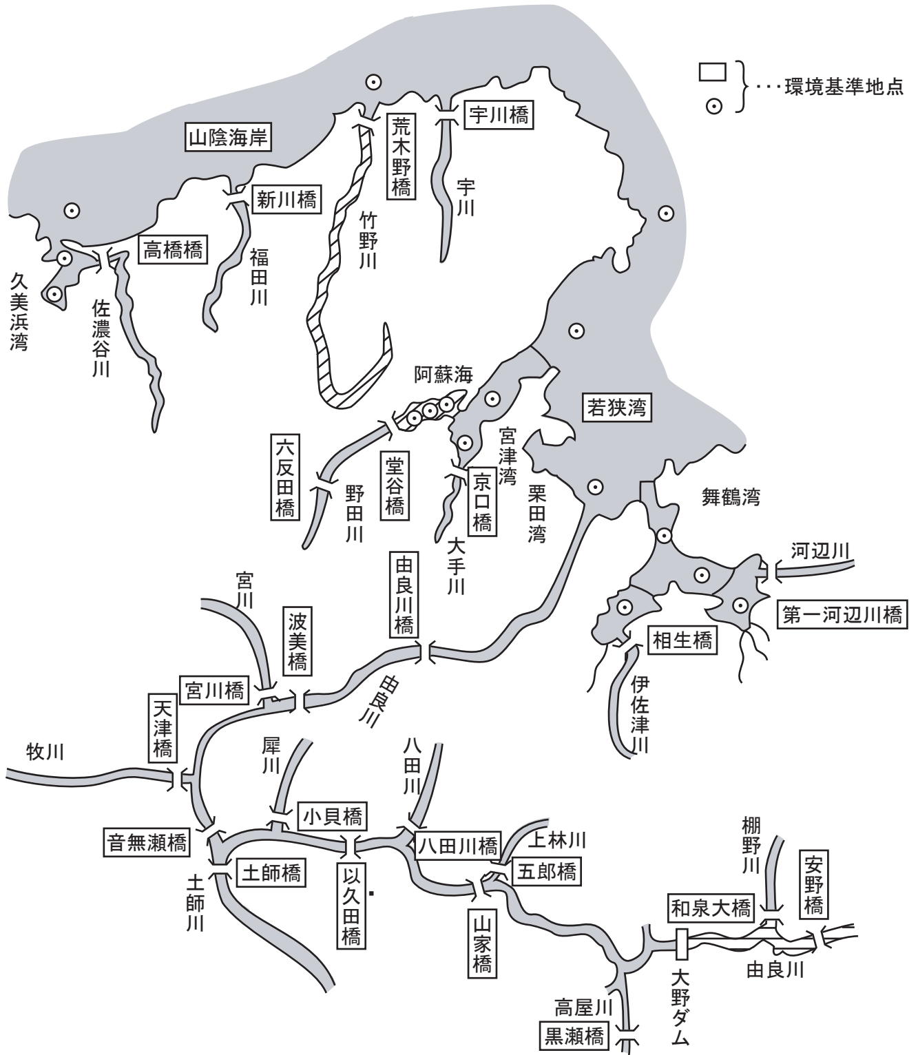
(イ) 北部河川・海域