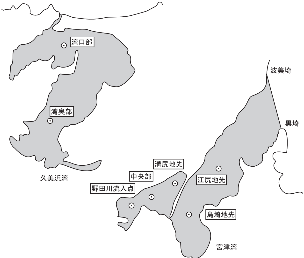
(ウ) 海域の全窒素・全磷