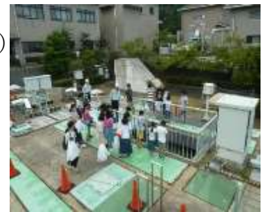
過去の様子（施設見学）