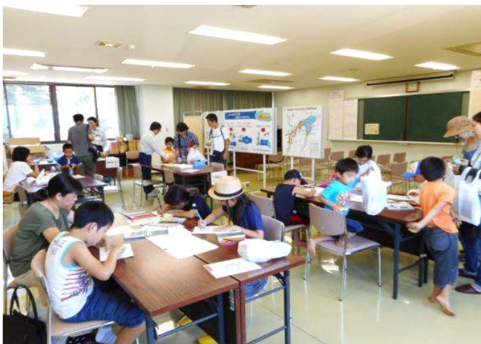
ろ過装置、ビデオ、ぬりえコーナー