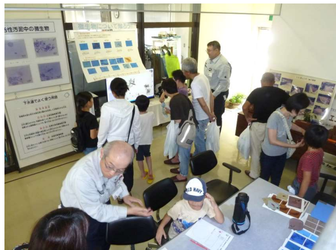
微生物観察コーナー