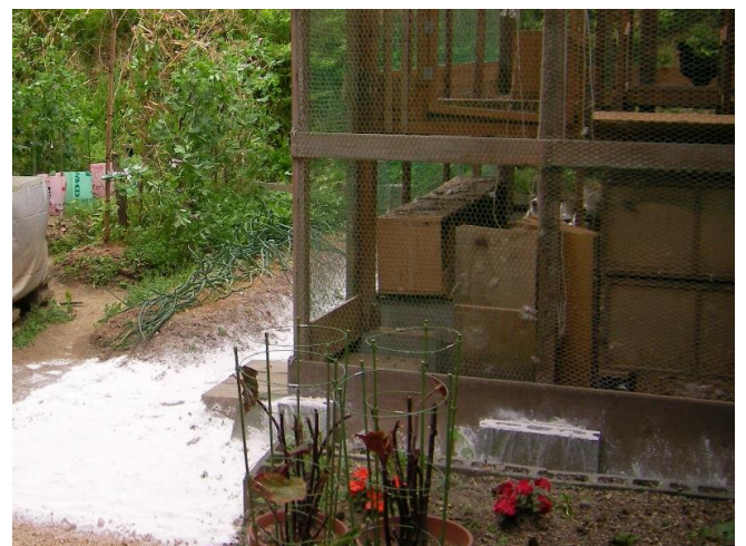
↑ 鶏舎周辺に散布した状態