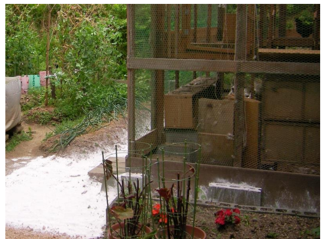
↑ 鶏舎周辺に散布した状態