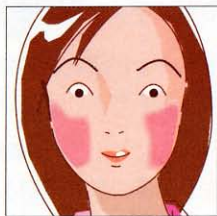
両側のほおに出現した 蝶翼状の発疹