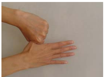
④親指を手掌でねじり洗いする(左・右)