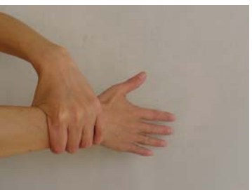
⑤手首を肘までねじり洗いする(左・右)