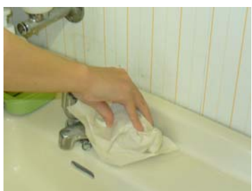
⑥水道栓を止めるときは、ペーパータオル等を使用して止める ※ポンプのノズルの汚染に注意