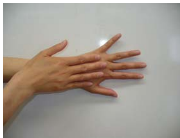
②手の甲を伸ばすように指の間までよく洗う(左・右) 小指の外側も忘れずに!