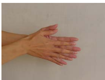
①手のひらを合わせ、指の間までよく洗う