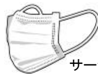
サージカルマスク