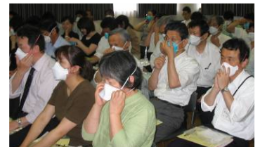
マスク着用方法の実習風景

参加者からは、「縦割り行政なので、全体での会議、取組が必要(市町保健師)」「住民にはまだまだ知られていないので、繰り返し啓発が必要(市町職員)」などの感想がありました。