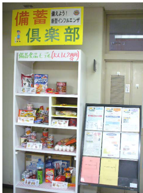
丹後保健所玄関ホールの展示コーナー

モデル国のスイスでも、住民への予防対策や備蓄に関する啓発が難しいのだとわかりました。