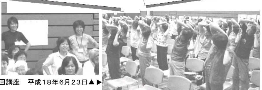
第1回講座 平成18年6月23日▲▶

地域の健康づくりの教室に参加してお手伝いをさせていただいたり、おたっしや体操などを近所や地域、職場で紹介していただき健康づくりの輪を広げます。