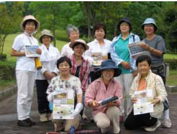
京丹後市連合婦人会の皆様

五感を開放し、心も体もリフレッシュできるウォーキング 皆さんも ぜひチャレンジを!!