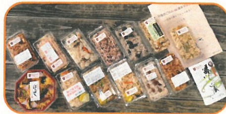
丹後の郷土ごはんのコーナー 作り方のレシピも配布しました