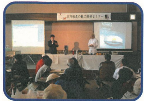
エスプーマ料理の講習会