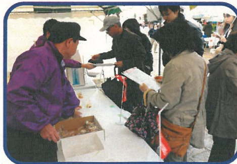
丹後あじわい食の試食後にアンケート調査