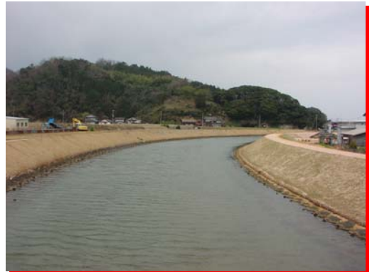
↑福田川(京丹後市網野町)↑