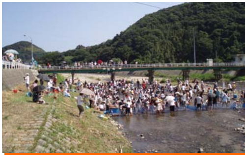
うかわ きょうたんごしたんごちょう ↑宇川(京丹後市丹後町)

ちいき じゅうみん はな あ した かわ 地域の住民のみなさんと話し合い、親しみのある川づくりをしています。